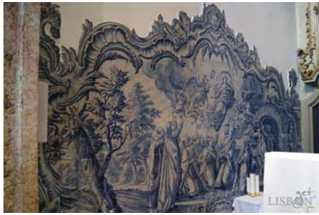
Assunção da Virgem

Programa Azulejar - Passos da Vida da Virgem Real Fábrica de Louça do Rato - Final do séc. XVIII