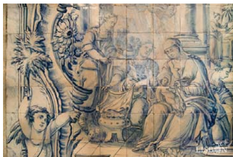
Nascimento da Virgem