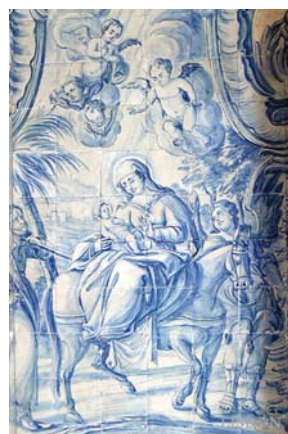
Fuga para o Egito