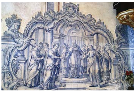
Casamento da Virgem