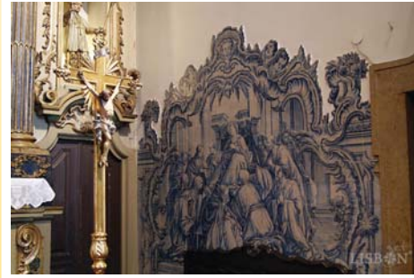
Morte da Virgem