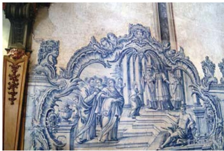
Apresentação no Templo